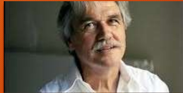
Vincent de Gaulejac