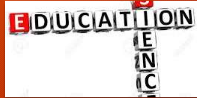
La formation des adultes