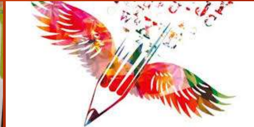
Et toutes les techniques inductrices du récit...