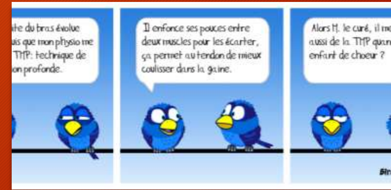
Sciences de gestion