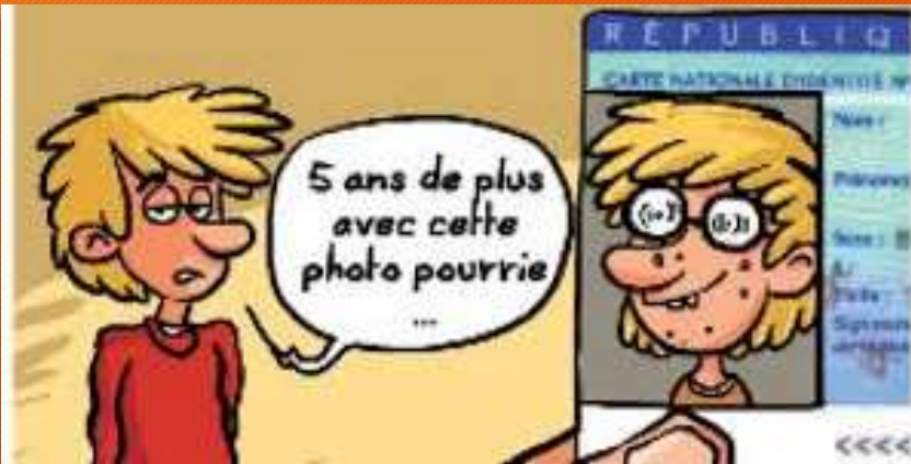
La carte d'identité