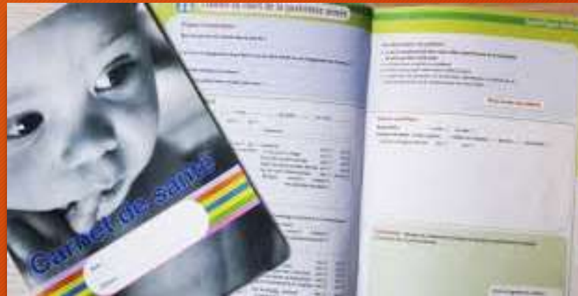
Le carnet de santé