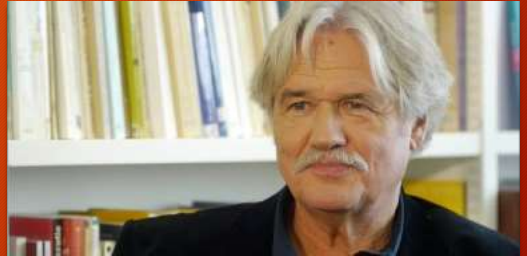
Sociologie clinique : Vincent de Gaulejac